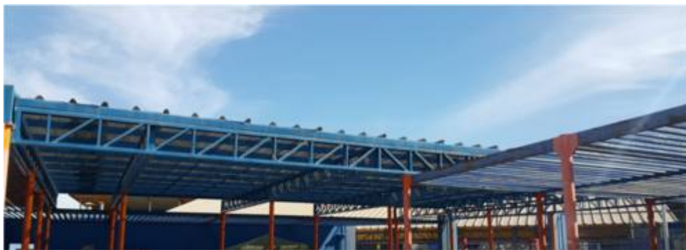
Ilustración Patio de Luz