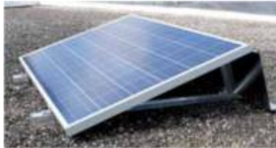
Ilustración – Estructura de anclaje Típica para módulos fotovoltaicos

La estructura de soporte de los módulos fotovoltaicos debe ser de aluminio, la cual debe cumplir funciones mecánicas tanto para la inclinación del conjunto de módulos fotovoltaicos que se instalarán como estructura de soporte y anclaje del campo fotovoltaico a la superficie seleccionada.