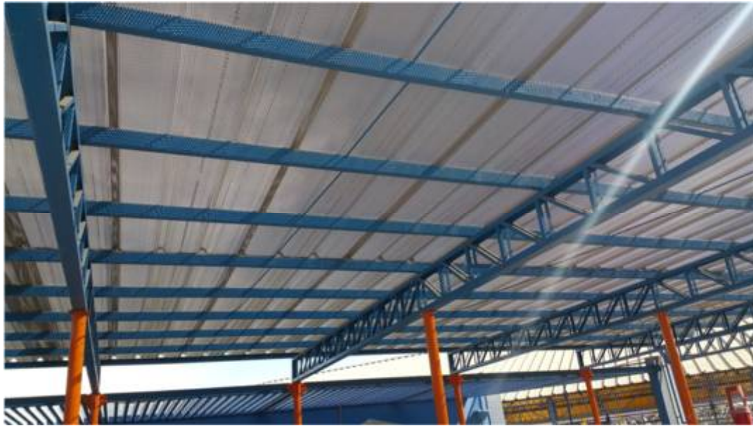
Ilustración vigas de metal