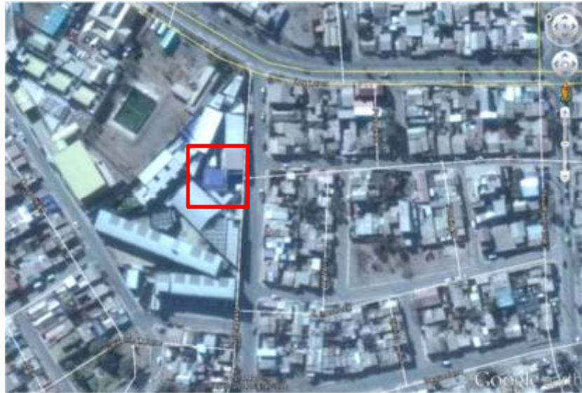
Ilustración - Ubicación del edificio por Google Earth