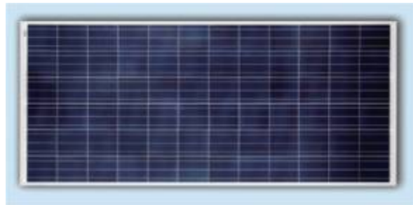
Ilustración - Módulo Fotovoltaico Tipo, Potencia de 250 W, dimensión de 1,6m x 1m, peso 15Kg aprox.

El principio de funcionamiento de éste tipo de generación, se basa en un proceso químico que transforma aquella radiación solar en energía eléctrica, donde se obtiene corriente continua (DC), no obstante lo que realmente se necesita es corriente Alterna (AC) , por lo que es necesario incorporar un equipo llamado inversor. Este equipo realiza dicho cambio, logrando adecuar la energía producida, en función de las variables eléctricas de Voltaje 220V AC y Frecuencia 50 Hz , dentro de los rangos considerables de calidad de Energía que debiese tener suministro eléctrico.