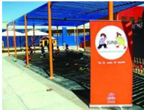
Ilustración - Fachada del edificio