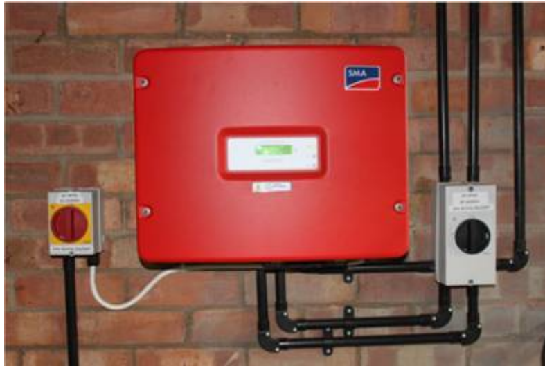
Ilustración -Típico montaje de un inversor

Adicionalmente a los requisitos que describe la normativa vigente, el o los inversores ofertados deben cumplir con los siguientes requisitos: