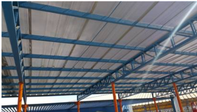
Ilustración - Planta de cubierta del edificio seleccionado

El presente informe de pre factibilidad, considera aprovechar la o las cubiertas de la edificación que sean más favorables para una óptima producción de Energía eléctrica (Kwh). En la siguiente ilustración se muestra la zona seleccionada que reúne estas condiciones, para la materialización del proyecto.