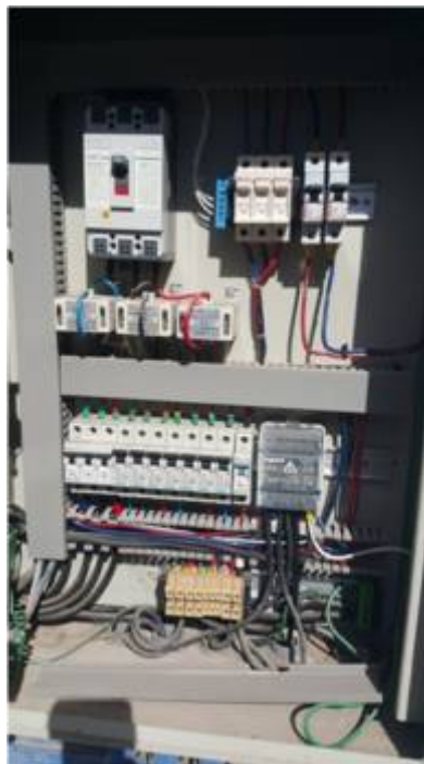
Ilustración – Interior tablero