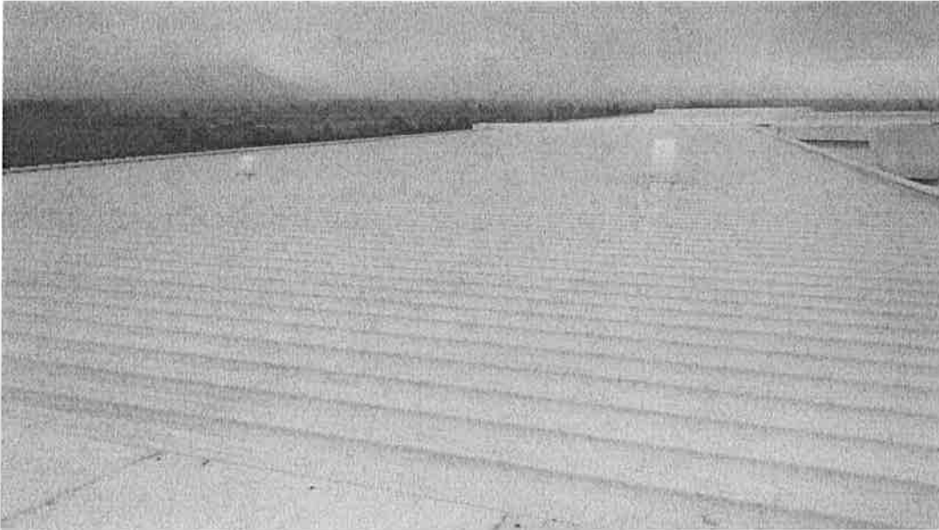
Ilustración – Techo seleccionado