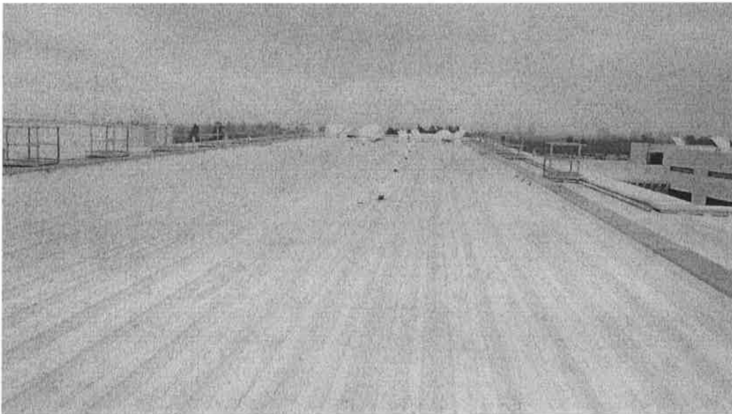
Ilustración – Techo seleccionado