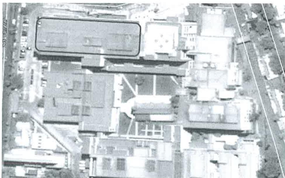
Ilustración – Techos seleccionados