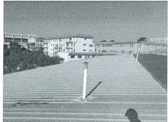
Ilustración – Techos seleccionados