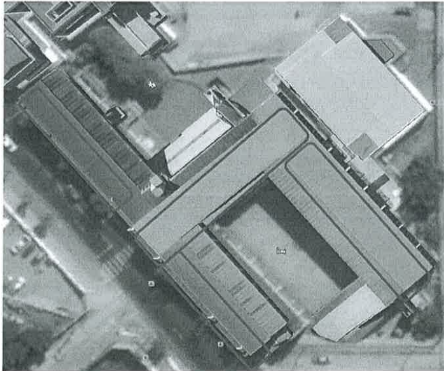
Ilustración – Techos seleccionados